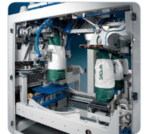
Plnicí místo a uzavírání pytlů