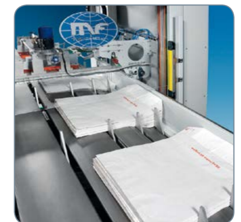
Zásobník prázdných pytlů